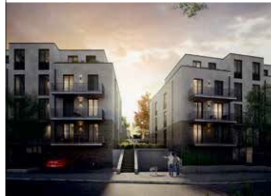
Cube-4-You Mettmann | 37 Eigentumswohnungen