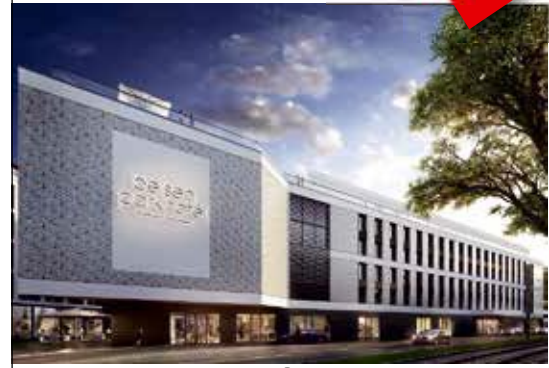
Belsen Parkhotel Düsseldorf