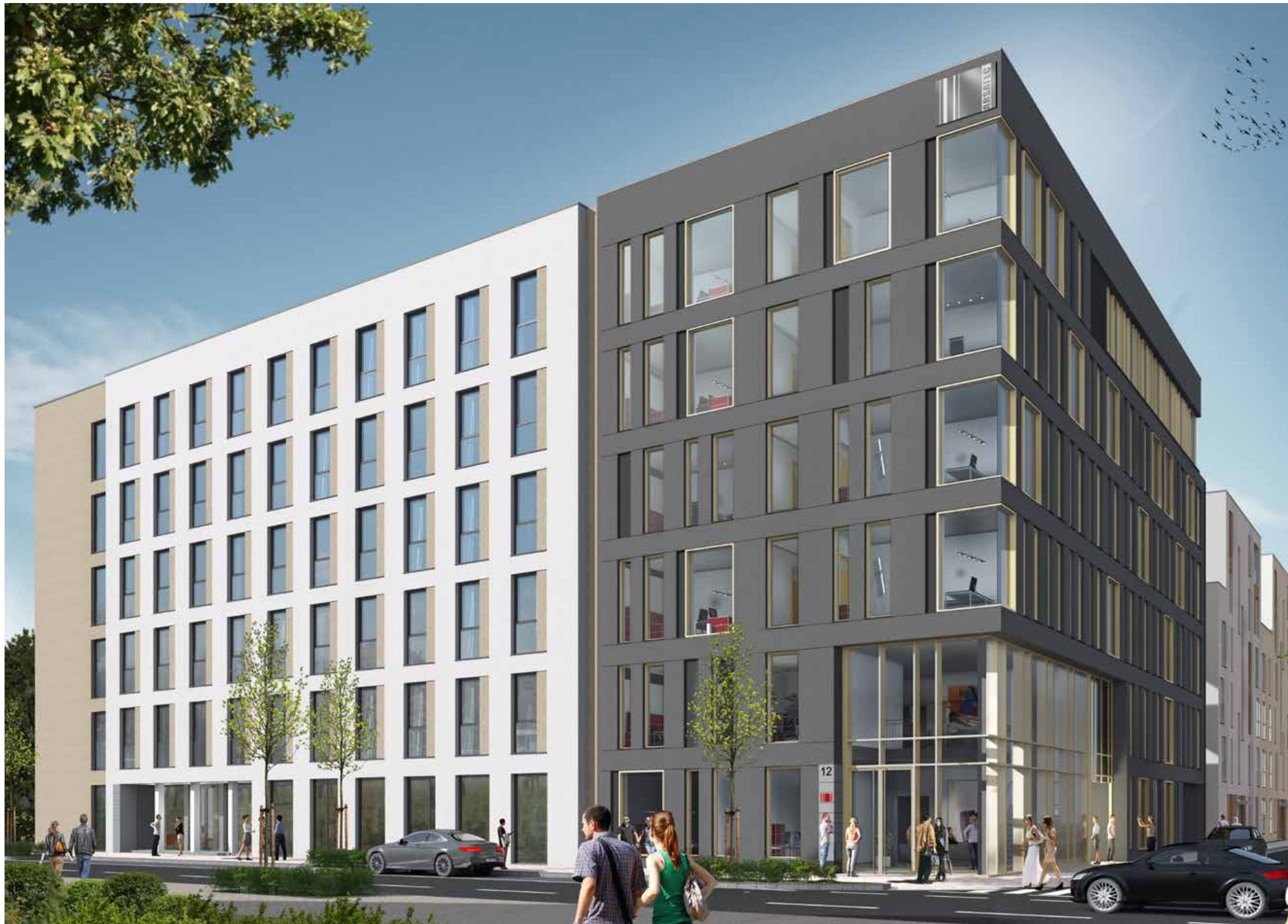
Mitten im Herzen von Essen an der Hachestraße haben demnächst Wohnungen und Büros einen neuen attraktiven Standort