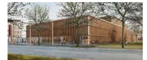
Das historische Archiv Eifelwall in Köln gehört zu den erfolgreichen HARFID-Projekten